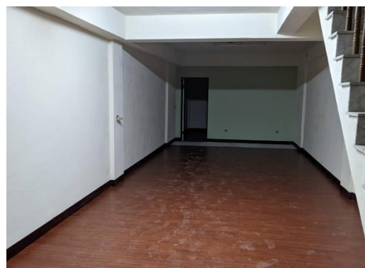
▲培力中心裝修工程