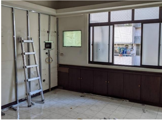
▲培力中心裝修工程