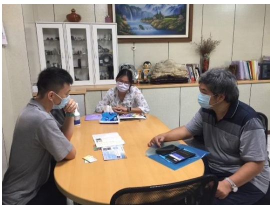
▲就業服務-愛心企業拜訪