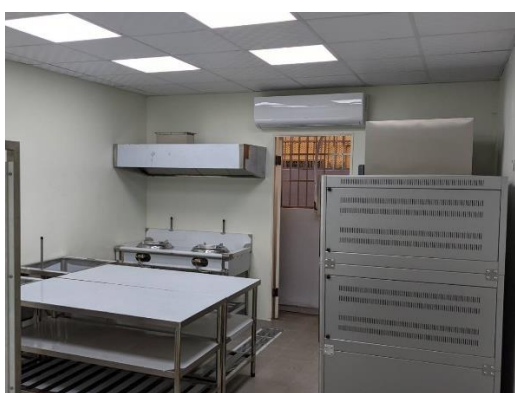
▲培力中心裝修工程