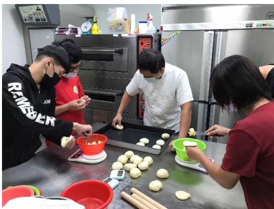
▲培力中心技職能課程