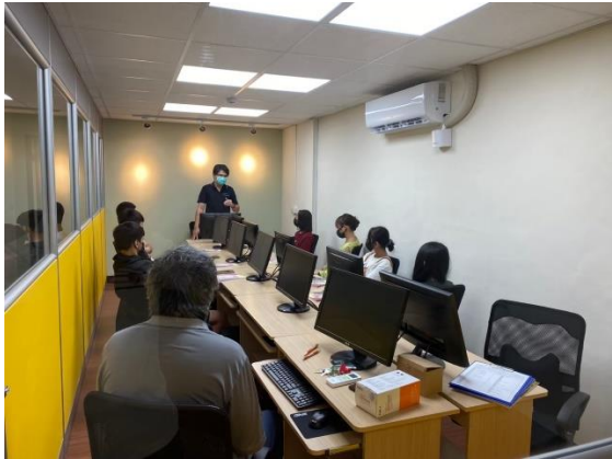
▲培力中心技職能課程