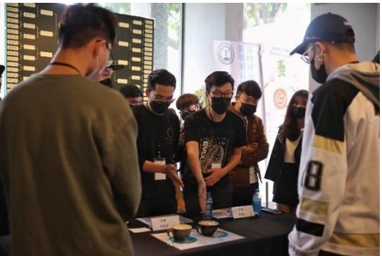
▲ 辦理咖啡拉花交流賽