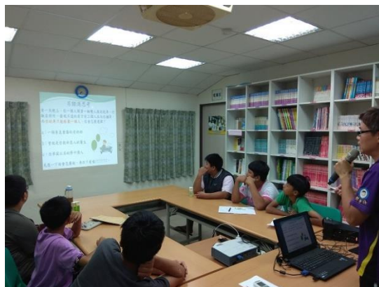
▲多元適性活動:品格教育課程