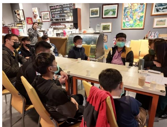
▲多元適性活動:星空電影院-電影賞析