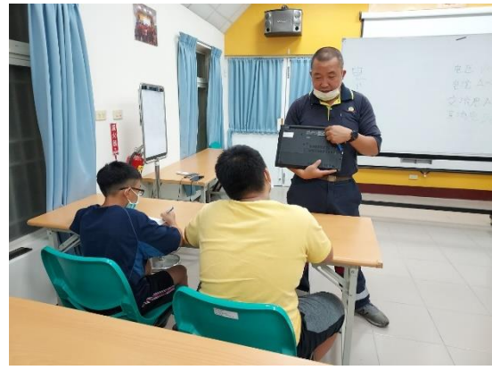
▲多元適性活動-愛物惜福 電器維修課